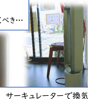
サーキュレーターで換気