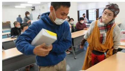
プレゼントゲッター☆