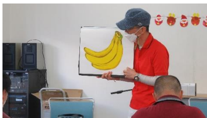
思わず吹き出す面白フリップ