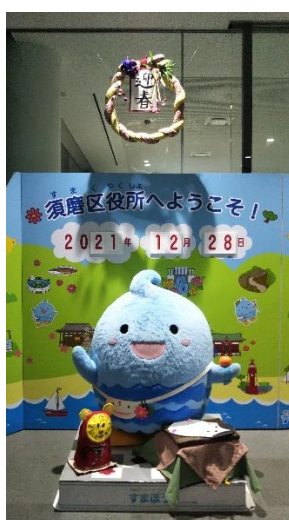
すまぼう 1月バージョン