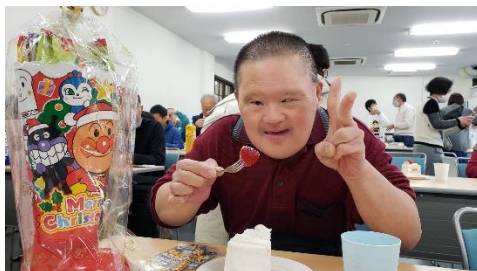
クリスマス会にケーキは欠かせない☺