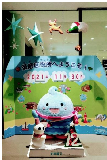
すまぼう 12月バージョン